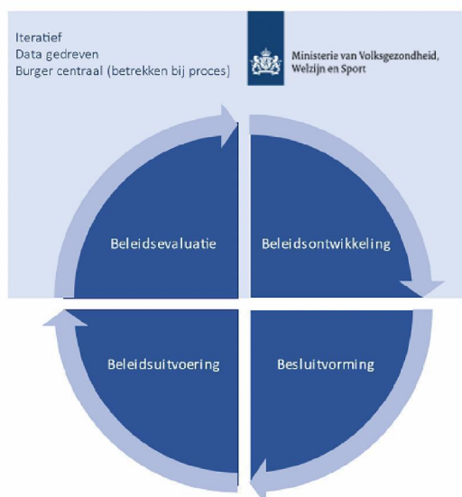
Figuur. De beleidscyclus VWS team data advies