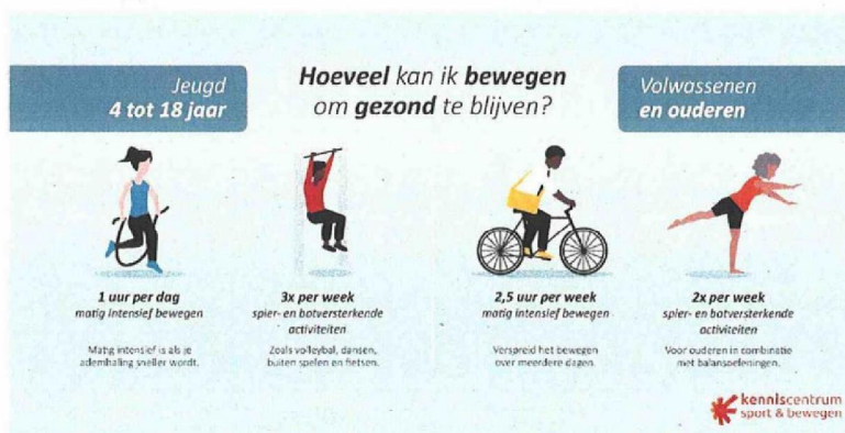
Figuur 1: De beweegrichtlijnen (Kenniscentrum Sport & Bewegen)

welk type lichaamsbeweging nodig is voor een goede gezondheid van jong tot oud, zie de adviezen in figuur 1.