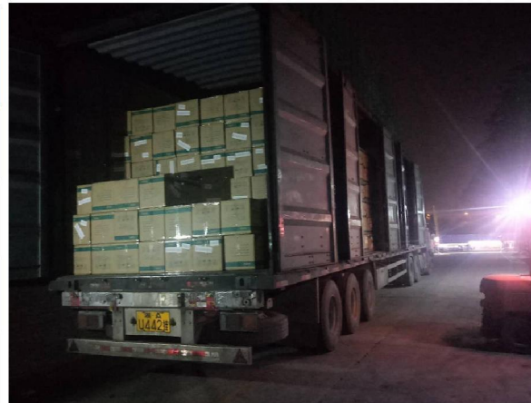
0,9 mln. FFP2 onderweg voor LCH