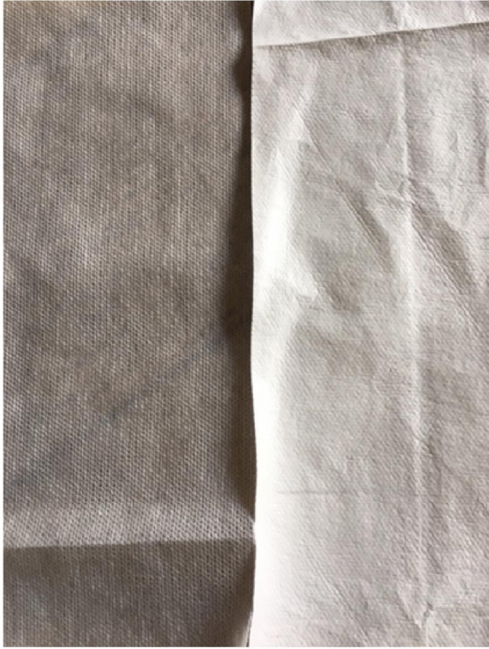
Links materiaal jas 1, rechts materiaal jas 2.