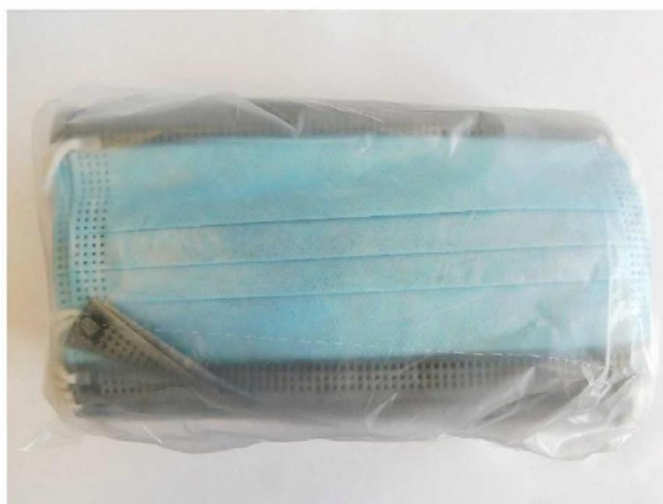
Abb. 1: Mask SQ