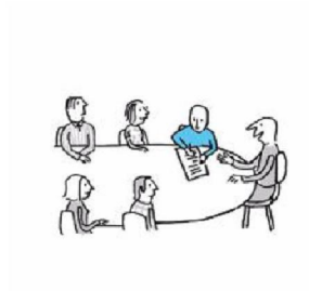
Afspraken maken met de griffier