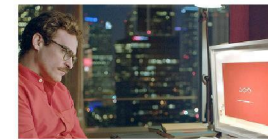
Quarantaine & chill? Dit is hoe je date ten tijde van de coronacrisis

De quarantainecoaches zijn een uitbreiding van de begeleiding en hulp die er nu al is voor mensen die in quarantaine zitten/vaarten. GGD-medewerkers besciden in hun gesprekken in het kader van bron- en contactonderzoek al aandacht aan de sociale en praktische dilemma's. En zij verwijzen naar hulpverleners van bijvoorbeeld het Rode Kruis, de AHBO of de Coördinatie en naar websites van hulporganisaties. Ook is er de quarantainegids met praktische tips en