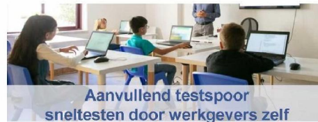
Aanvullend testspoor sneltesten door werkgevers zelf