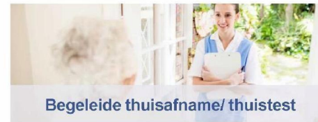
Begeleide thuisafname/ thuistest