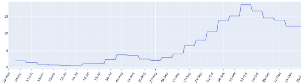
FIGUUR (t/m donderdag 26 november): trend in percentage positief landelijk