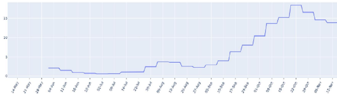
FIGUUR (t/m donderdag 17 november): trend in percentage positief landelijk