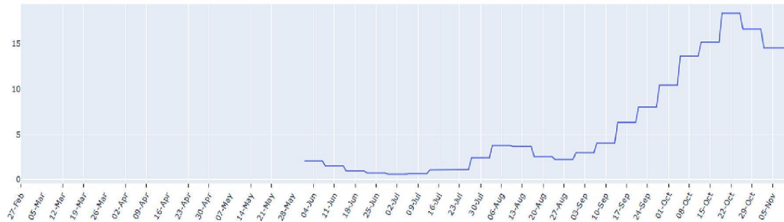
FIGUUR (t/m woensdag 11 november): trend in percentage positief landelijk