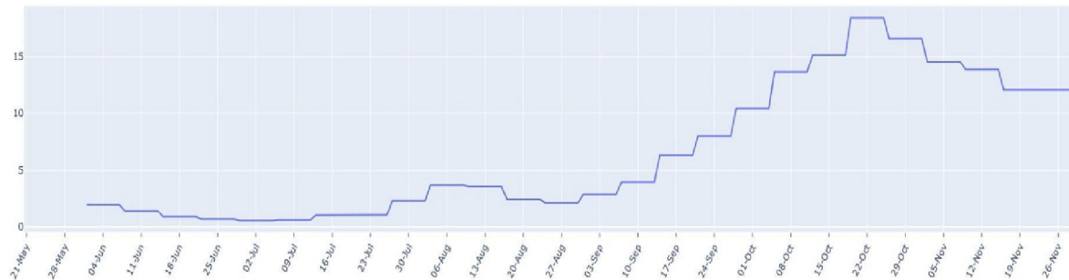
FIGUUR (t/m maandag 30 november): trend in percentage positief landelijk