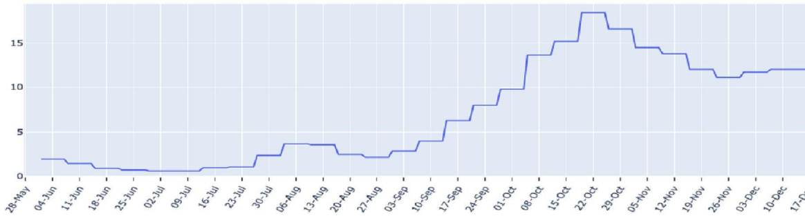
FIGUUR (t/m donderdag 17 december): trend in percentage positief landelijk