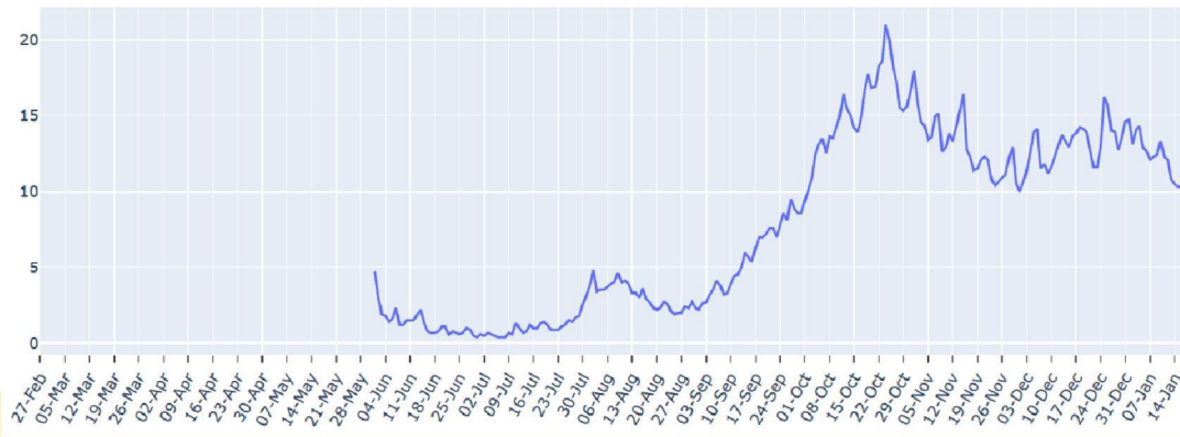
FIGUUR (t/m maandag 18 januari, dagelijks): trend in percentage positief landelijk