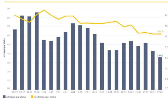
Deze grafiek laat de trend zien van het aantal positieve uitslagen en het percentage positieve uitslagen.