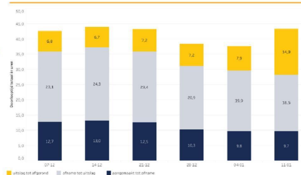
Landelijke gemiddelde doorlooptijden PCR testen in reguliere GGD teststraten.