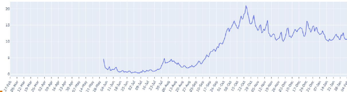
FIGUUR (t/m donderdag 4 februari, dagelijks): trend in percentage positief landelijk