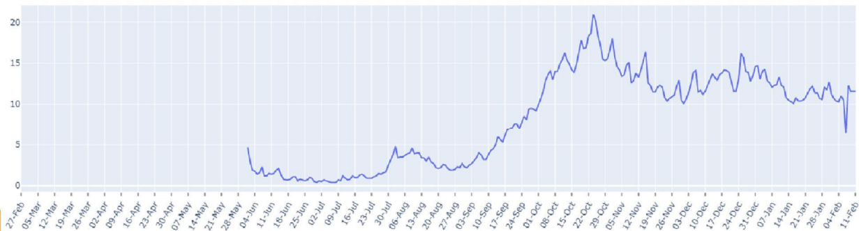
FIGUUR (t/m donderdag 11 februari, dagelijks): trend in percentage positief landelijk