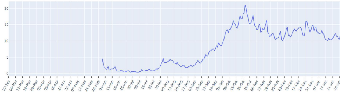
FIGUUR (t/m maandag 1 februari, dagelijks): trend in percentage positief landelijk