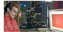
Quarantaine & chill? Dit is hoe je date ten tijde van de coronacrisis

De quarantainecoaches zijn een uitbreiding van de begeleiding en hulp die er nu al is voor mensen die in quarantaine zitten/vaarten. GGD-medewerkers besciden in hun gesprekken in het kader van bron- en contactonderzoek al aandacht aan de sociale en praktische dilemma's. En zij verwijzen naar hulpverleners van bijvoorbeeld het Rode Kruis, de AHBO of de Coördinatie en naar websites van hulporganisaties. Ook is er de quarantainegids met praktische tips en