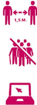
1,5m afstand afstand houden