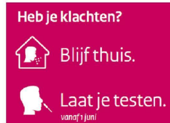
thuis blijven & testen