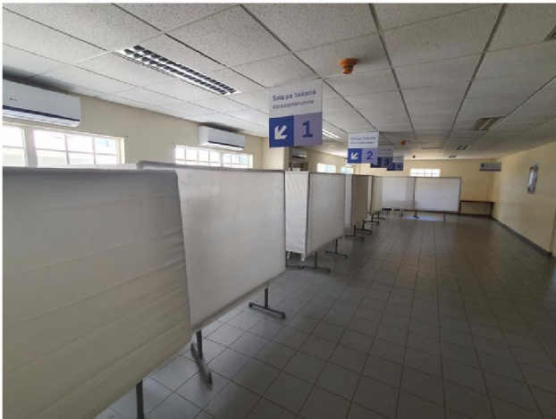
Priklokaal 1 (5 lijnen)