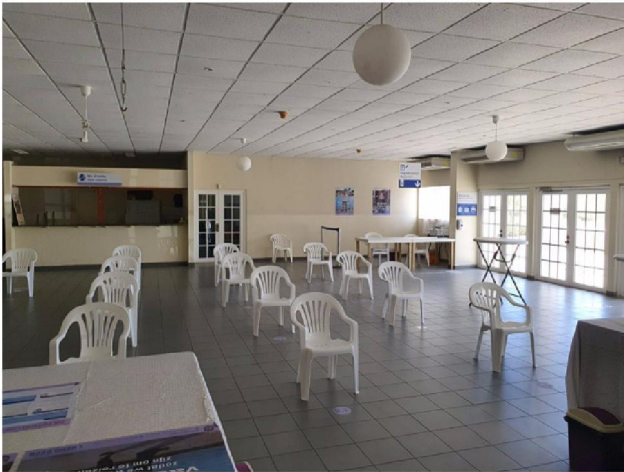
Registratie en wachtkamer