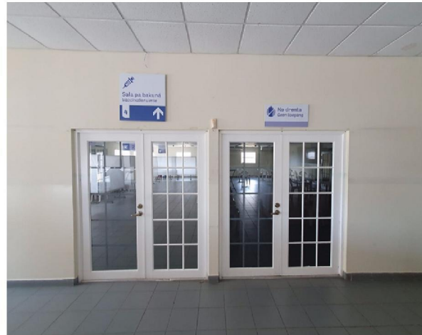
2 aparte priklokalen