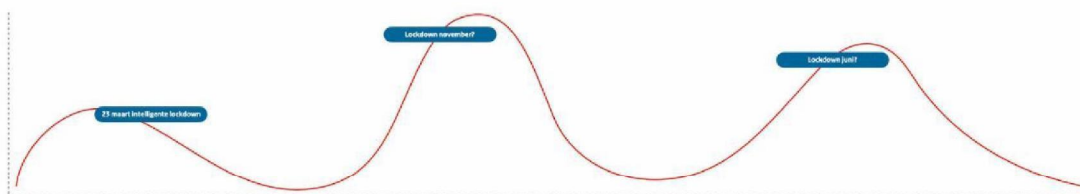
Afbeelding 1: een lockdownsamenleving

De wereld werd eerder dit jaar opgeschrikt door SARS-CoV-2 en de verspreiding en indamming van dit virus houdt Nederland dagelijks bezig. Momenteel beweegt Nederland, net als veel andere landen, van lockdown naar lockdown. Een lockdown brengt het aantal besmettingen fors omlaag waarna de samenleving langzaam weer opengesteld kan worden, maar breekt een significant deel van het sociale leven en de economie wel af. Het openstellen van de samenleving leidt vervolgens weer tot meer verspreiding van het virus. Dit openstellen leidde na de eerste lockdown in veel landen tot een tweede lockdown.