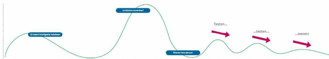
Afbeelding 2: indammen via testen, traceren en isoleren

Het volledig virus-vrij maken en houden zoals bijvoorbeeld in Nieuw-Zeeland is gedaan wordt voor Nederland niet realistisch geacht gezien onze positie en rol in de wereld. Om te voorkomen dat openstelling bij een laag aantal besmettingen leidt tot steeds grotere aantallen besmettingen en dus een volgende lockdown, is het noodzakelijk om zo snel mogelijk zo veel mogelijk besmettingen op te sporen en in te dammen. Dit kan enkel gerealiseerd worden met grootschalige, laagdrempelige, georganiseerde testtoegang.