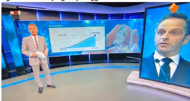
NOS Journaal gemist? Start met kijken op NPO Start (7 minuut en 40 sec)

Hoe kan het dat er minder prikken zijn gezet dan gepland. "Hugo de Jonge kwam met een opvallende verklaring". Hugo de Jonge: "we weten het niet precies maar het kan doordat afspraken worden verzet of niet worden gemaakt door mensen". NOS Joris van Poppel geeft aan dat het mensen ook niet makkelijk werd gemaakt. Het GGD telefoon systeem was vaak overbelast. Ernst Kuiper geeft aan dat ziekenhuizen met gemak meer dan 2 miljoen per week kunnen prikken. NOS signaleert dat zij eigenlijk zeggen "had ons maar veel eerder gevraagd te helpen"