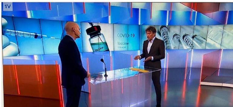
Prikken gaat minder snel dan verwacht, ziekenhuizen bieden hulp aan: 'Elke week telt' - EenVandaag (avrotros.nl) (fragment)