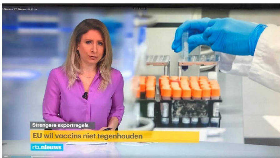
RTL Nieuws - 06:30 uur | RTL Nieuws (eerste item)