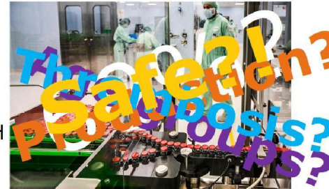
Vials of the University of Oxford's and AstraZeneca's vaccine candidate in a facility in Anagni, Italy, which will participate in large-scale production of the vaccine after regulatory approval. VACCINO FANTASMA VIA GETTY IMAGES After dosing mix-up, latest COVID-19 vaccine success comes with big question mark By Jon Cohen | Nov. 25, 2020, 11:49 AM