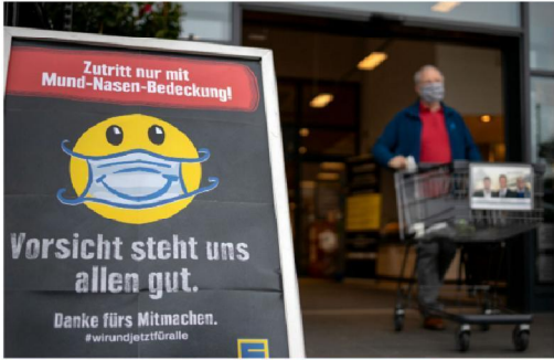
Borden buiten supermarkten