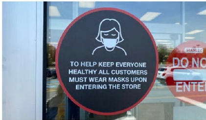
Many stores across Canada, like this Winners store in Halifax, are now requiring that people wear masks to shop.