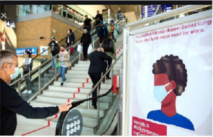
Bord buiten een winkel