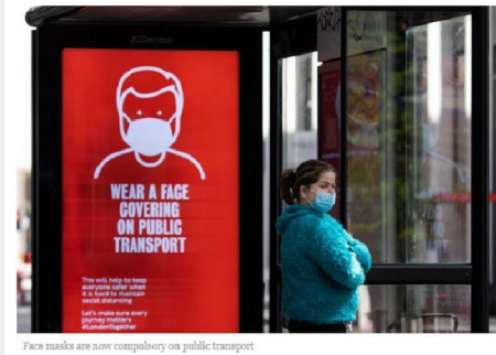
Face masks are now compulsory on public transport