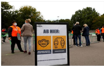
FILE PHOTO: A poster informing about hygiene rules is seen as people enter Berlin's Waldkranken amphitheatre as it reopens following the coronavirus disease (COVID-19) outbreak, in Berlin, Germany September 3, 2020. REUTERS/Michael