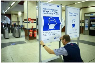
Failure to adhere to the new measures on public transport could result in a Fine.