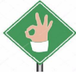
Succes / afgerond