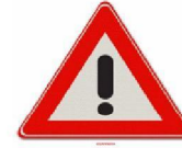
Nog mee starten