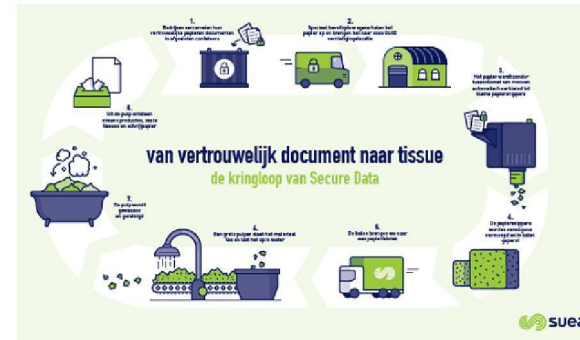
Weergave verwerking vertrouwelijke documenten stroom