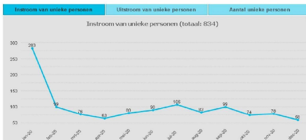
Figuur 3a: instroom jeugdzorg, 5 kwetsbare wijken, maandcijfers 2020:

NB: januari betreft voor een groot deel administratieve correcties