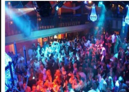
natte horeca & discotheken