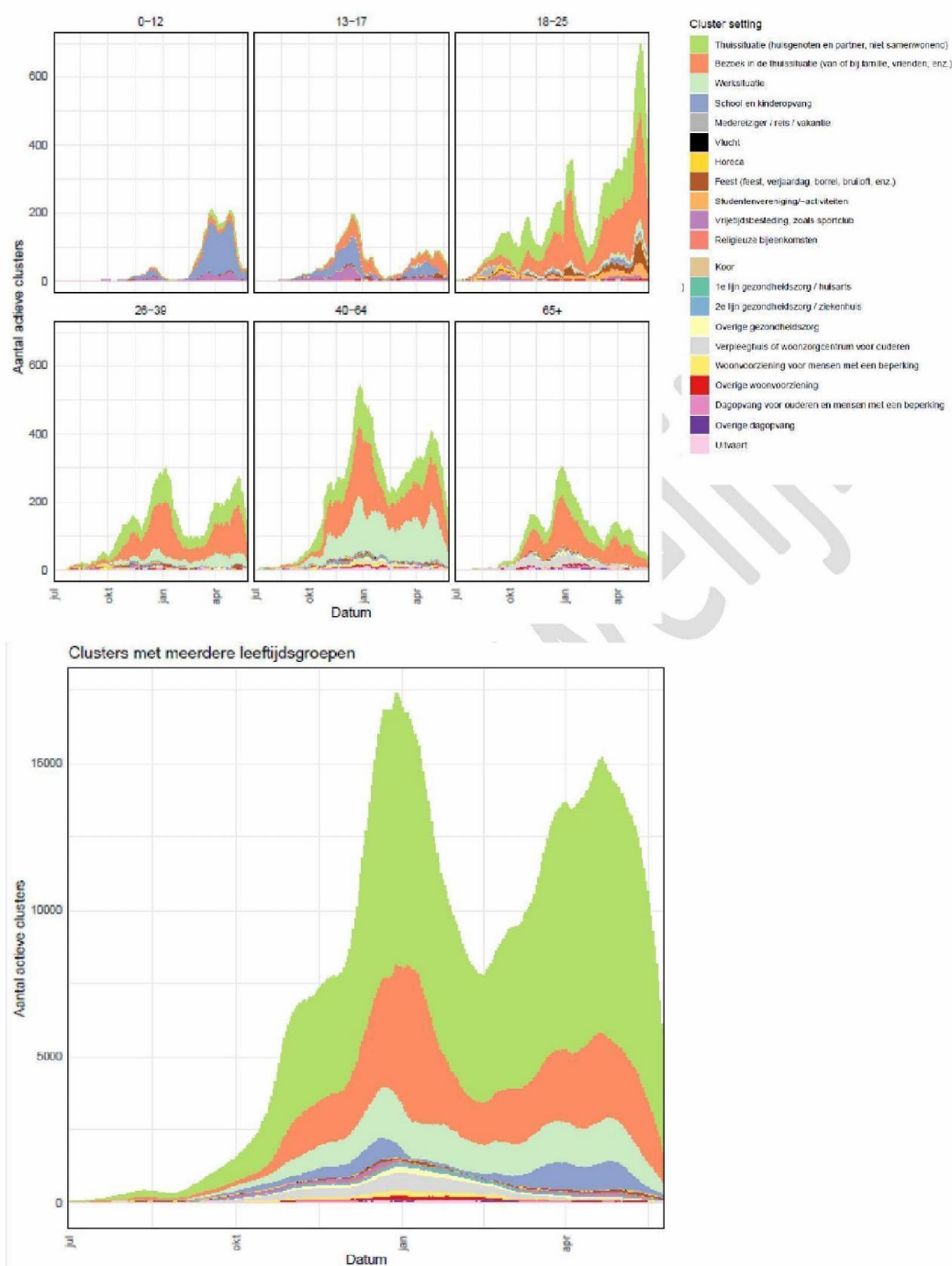
Figuur 2. Absoluut aantal clusters en absoluut aantal clusters per leeftijdscategorie, uitgesplitst naar type setting