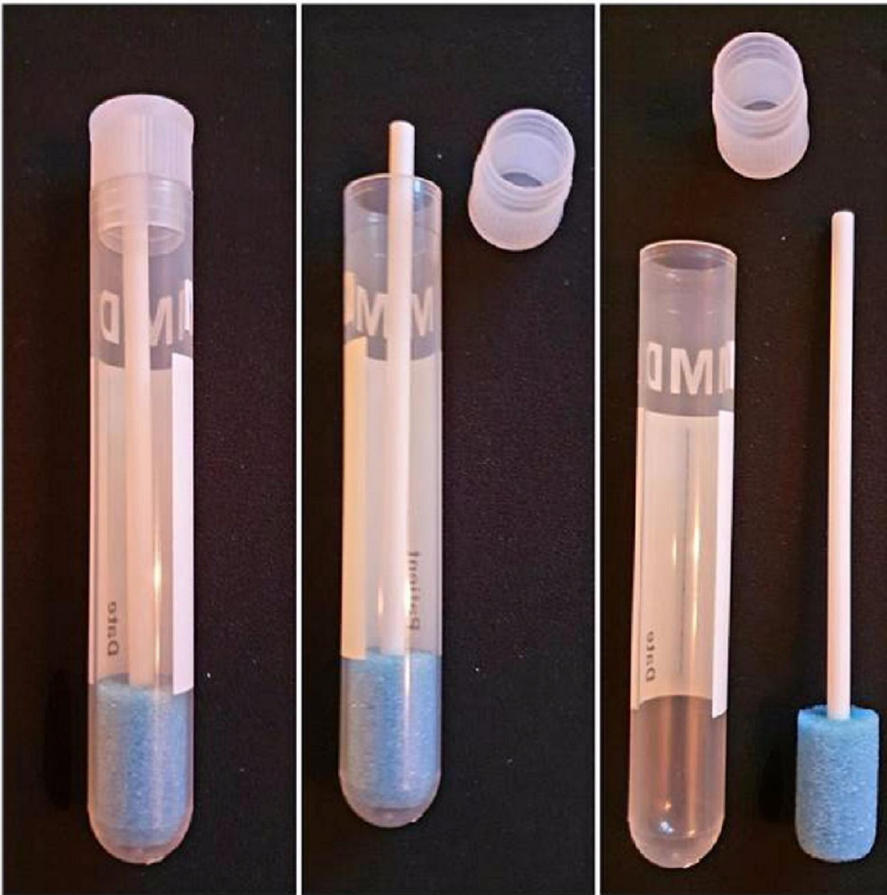
Figuur 2. Oracol S10 speeksel verzamel systeem. In de huidige opzet wordt alleen de spons gebruikt en uitgeperst in de Isohelix verzamelbuis. Verkrijgbaarheid speekselspons zonder buis wordt onderzocht.

De Oracol S10 spons op stokje wordt door de afnemer alleen gebruikt om speeksel te verzamelen en vervolgens in de verzameltrichter uit te persen en dit te herhalen tot tussen de 1 en 2 ml speeksel is verzameld in de buis. De trechter en de Oracol S10 spons worden weggegooid als besmet afval. De buis met speeksel wordt vervolgens naar het lab getransporteerd en het speeksel kan dan in het lab overgepipetteerd worden in de extractiebuis.