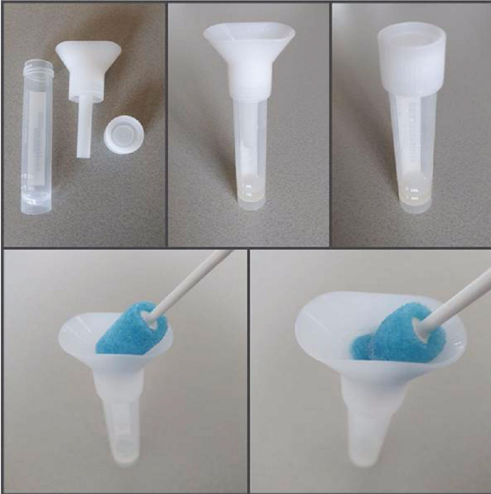
Figuur 1. Isohelix speeksel verzamelbuis met opschroeftrechter met terugloopbeveiliging en manier van gebruik met Oracol S10 speekselspons. Na speeksel verzamelen met de spons wordt deze uitgedrukt in de trechter en herhaald tot 1-2 ml speeksel is verzameld.