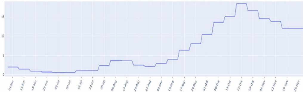
FIGUUR (t/m zondag 29 november): trend in percentage positief landelijk