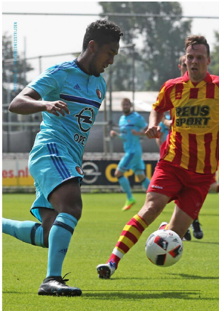
ROUWEN VAN WEDSTRIJDEN