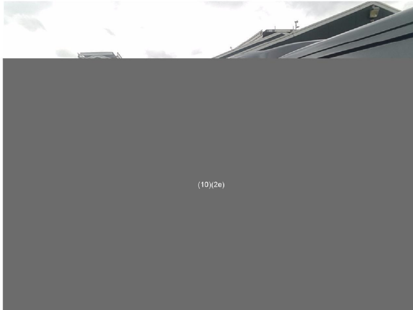
Fig. 2 Persoonlijke monstername met Gilian GilAir 5 pomp, monstername inhaleerbaar stof met GSP samplers