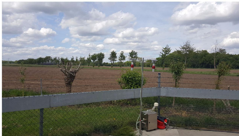
Fig 3. Meetopstelling vierdaagse metingen op het erf, Derenda 10 L/min met Harvard impactor (PM 10 ).