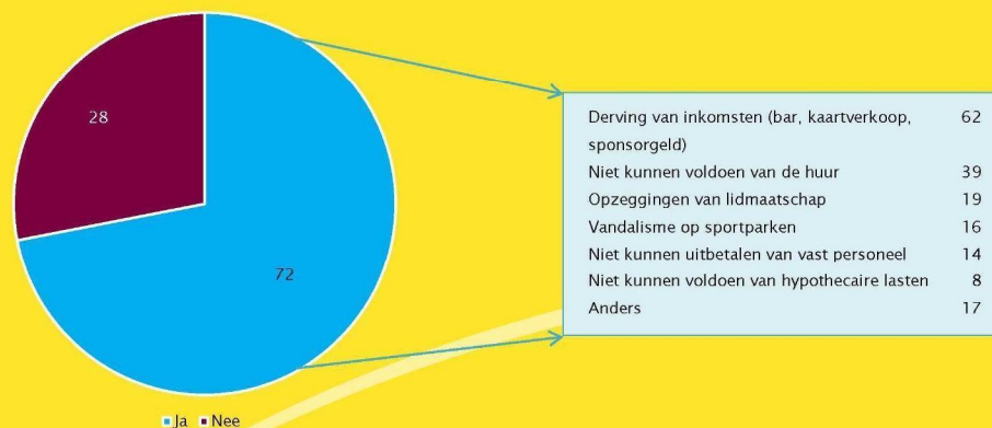
Figuur 3 Percentage gemeenten waar verenigingen zich eind maart/begin april hebben gemeld met problemen en uitsplitsing van de aard van de problemen van verenigingen (in procenten van gemeenten; n=156)