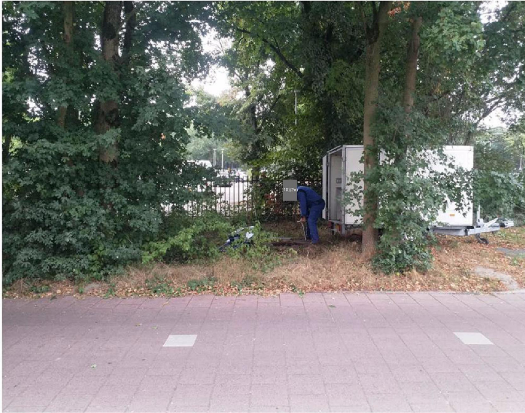
Utrecht Leidsche Rijn College