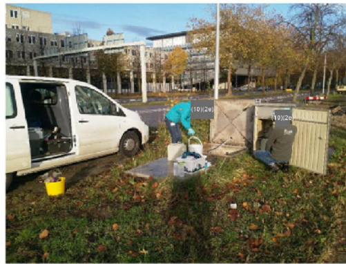
debietbepaling? => data van (10)(2e)