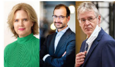
i.o.m. minister die het aangaat