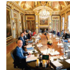
i.o.m. gevoelen min