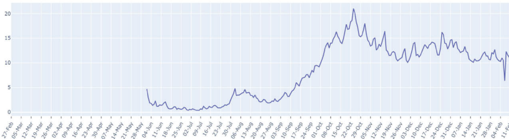
FIGUUR (t/m zondag 14 februari, dagelijks): trend in percentage positief landelijk