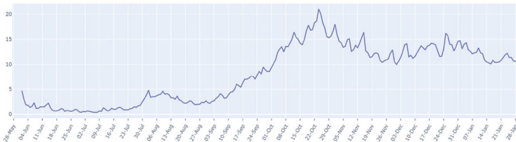
FIGUUR (t/m zondag 31 januari, dagelijks): trend in percentage positief landelijk