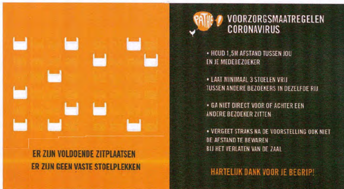
Afbeelding: Dia in de zaal tijdens inloop voorstelling, Pathé Theaters B.V.